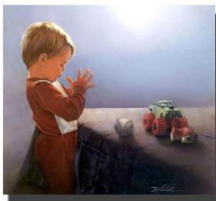
Child's Prayer Copyright 2002 by Denny Harlbohm. All rights reserved by the artist.

"Învăță pe copil calea pe care trebuie s'o urmeze, și când va îmbătrâni, nu se va abate de la ea."